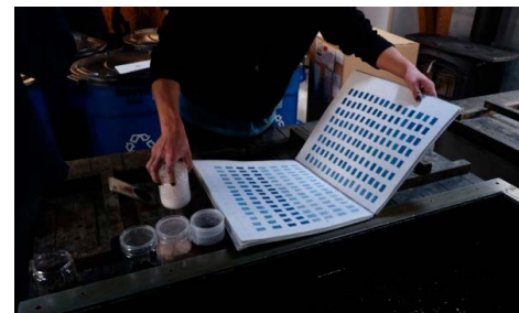
Indigo, Shikoku II.26

9h30–10h Présentation de la journée «Chimies organiques» consacrée aux couleurs et à la teinture Avec Olivier Gosselain