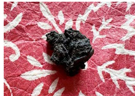
Indigo, Shikoku II.26

10h–12h Mémoire des fibres – teinture végétale et plissage Avec Harumi Sugiura (Couleur Garance – Harumi Textile) www.harumitextile.com www.couleur-garance.com